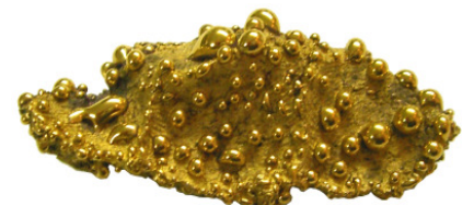
White Pebble mit Glanzgold. Die matten Stellen bleiben matt, die Kügelchen bekommen einen Glanz.

Glanzgold Y 12 % - gebrauchsfertig 550 - 800 °C 2 g, Fläschchenstreichfertig G-GG2 Fr. 42.00 Glanzplatin PBC P20 - gebrauchsfertig 550 - 800 °C 2 g Fläschchen, streichfertig G-GP2 Fr. 38.00