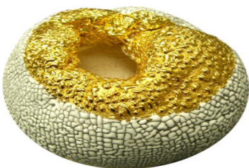
Steinzeugton weiss mit White Pebble im Elektroofen auf 1040 °C und anschliessend mit Glanzgold überstrichen auf 800 °C gebrannt

Je dicker die Glasur aufgetragen wird ( 1 - 8 Anstriche ) desto grösser werden die Reliefmuster. Funktioniert auf unglasiertem oder engobiertem Ton. Beim Auftrag auf eine Glanzglasur verschmilzt die Glasur und kann sich nicht zusammenziehen.