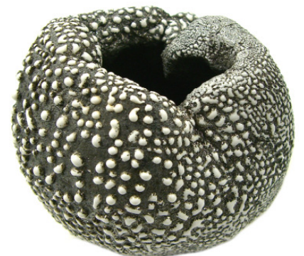
White Pebble im Rakubrand auf 1000 °C und n Sägemehl reduziert