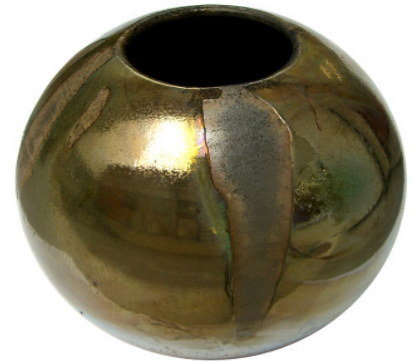
Goldlüster im Rakubrand auf 1000 °C und nach 10 Sekunden an der Luft in einer Tonne mit Sägespänen reduziert