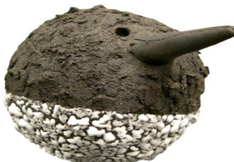
Steinzeugton Togo auf 1260 °C vorgebrannt und im 2. Brand mit White Crawl im Elektroofen auf 1040 °C gebrannt